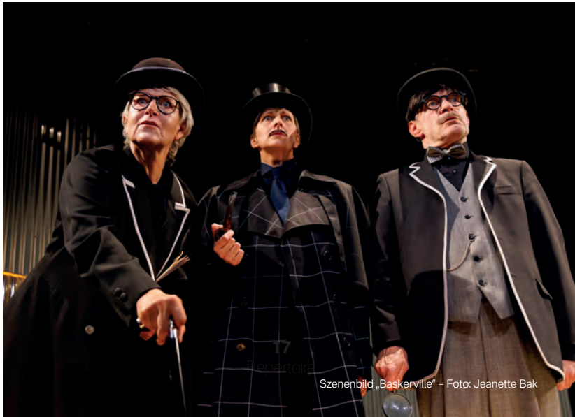
Szenenbild „Baskerville“