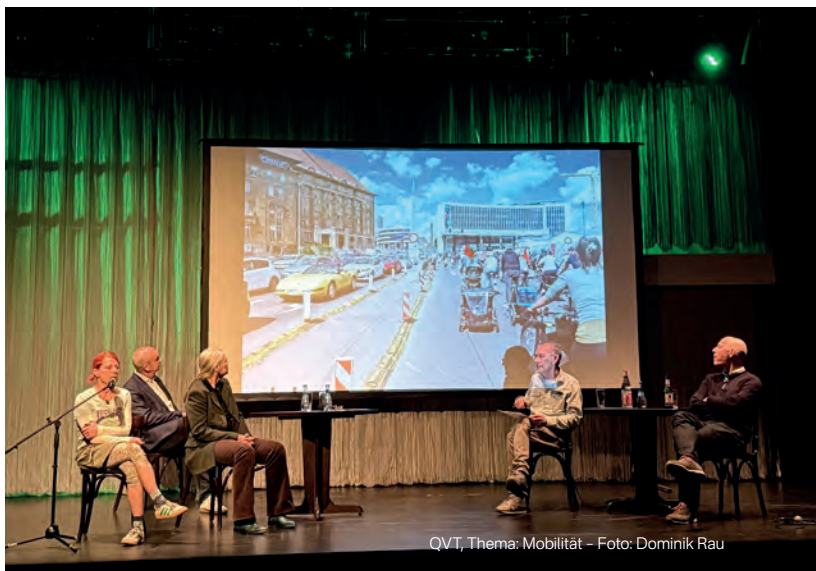
QVT, Thema: Mobilität – Foto: Dominik Rau