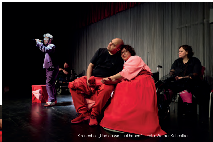
Szenenbild „Und ob wir Lust haben!“