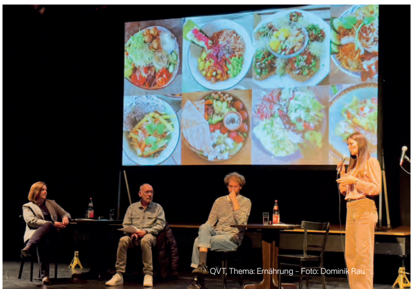
QVT, Thema: Ernährung