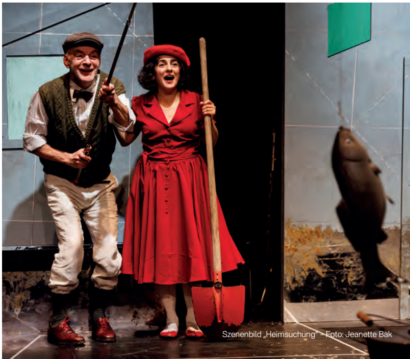
Szenenbild „Heimsuchung“