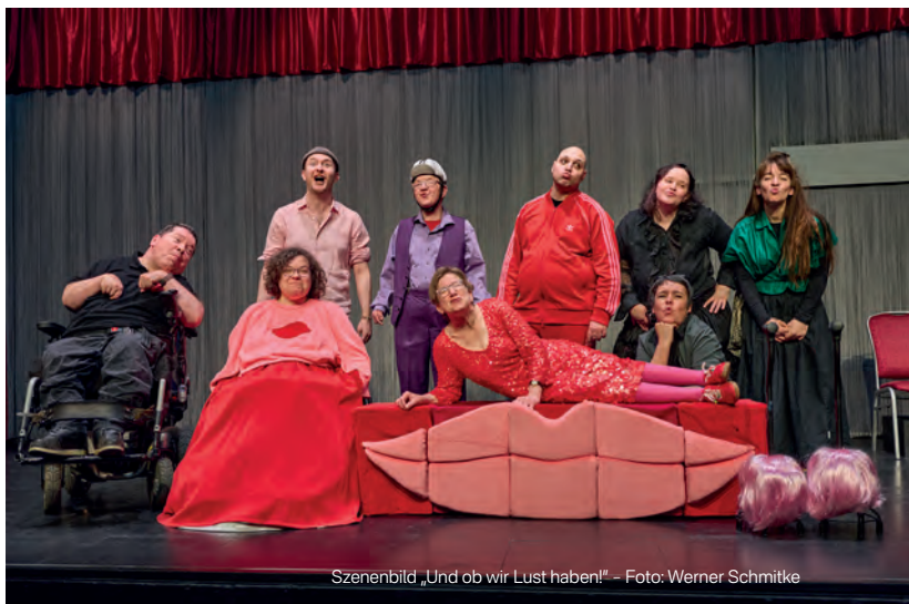
Szenenbild „Und ob wir Lust haben!“