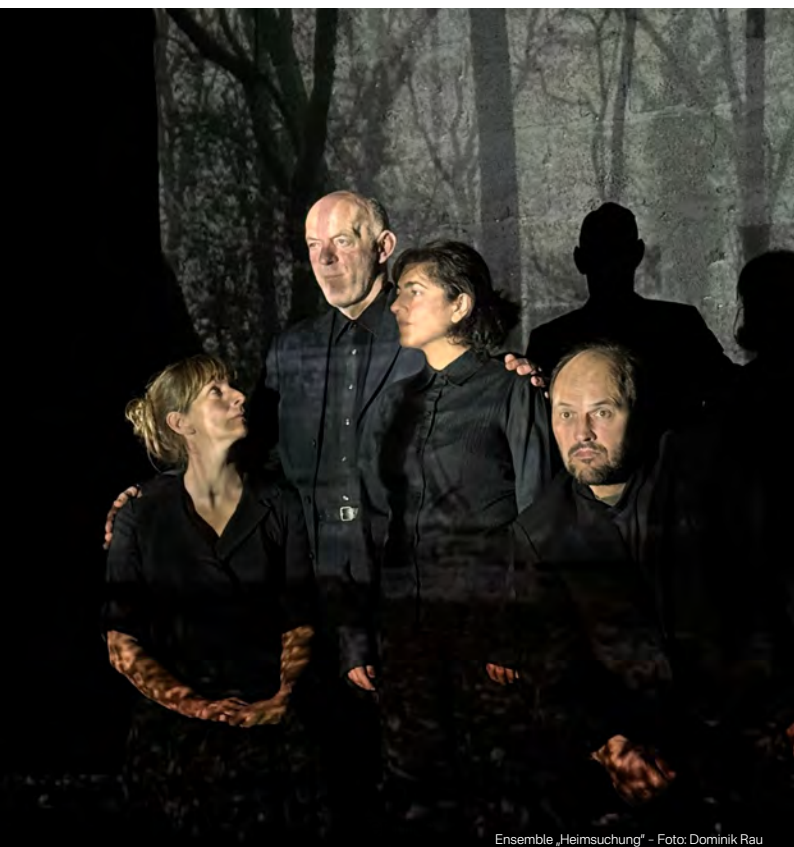
Ensemble „Heimsuchung“